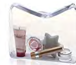
Kosmetiktasche, PVC transparent mit Boden und Reißverschluß