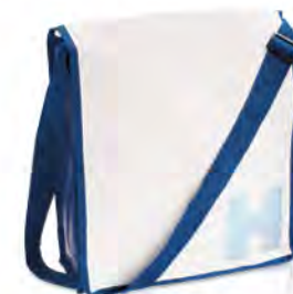
PP-Non Woven mit matter Laminierung, Randsäumung und verstellbarem Schultergurt