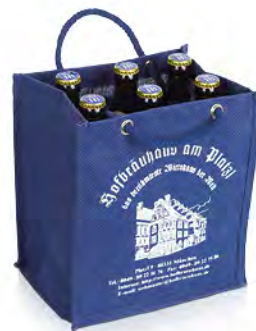
Jute mit Gittertrennung, Metallösen und Baumwollkordeln