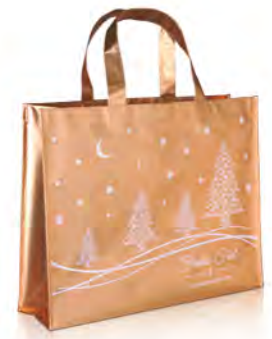
PP-Non Woven mit Alukaschierung in gold