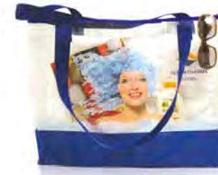
PVC Transparent mit Nylonhenkeln