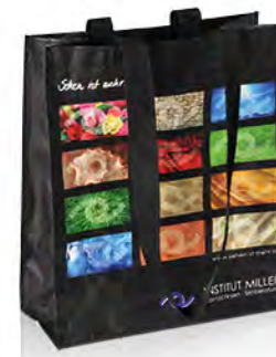
PP Woven mit 4-farbigem Tiefdruck