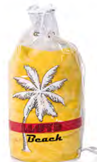
PVC transparent mit Metallösen