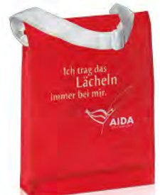
PP Woven mit glänzender Laminierung und verstellbarem Schultergurt