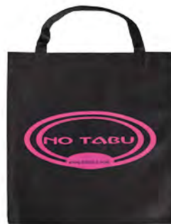
PP-Non Woven mit kurzen Nylonhenkeln