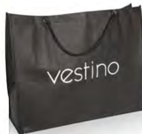
PP-Non Woven mit Metallösen und Baumwollkordeln