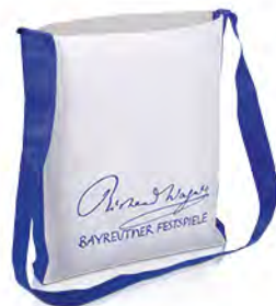
PP-Non Woven mit breitem Schultergurt