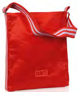
Nylon mit Reißverschluss und verstellbarem Schultergurt