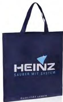
PP-Non Woven mit 2-farbigem Druck