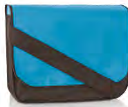
PP-Non Woven mit breitem Schultergurt