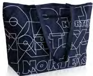
Polyester mit kleiner Tasche und Reißverschluss