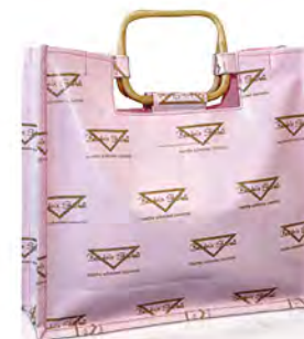
Baumwolle mit glänzender Laminierung und Holzhenkeln