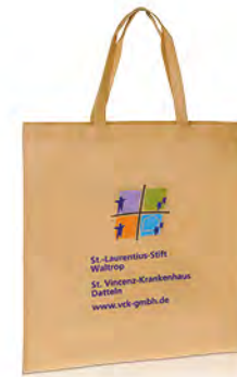
PP-Non Woven, mit 4-farbigem Druck