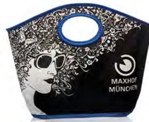
Mit Randsäumung und rundem Griffloch