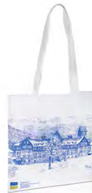
PP-Non Woven mit langen Henkeln