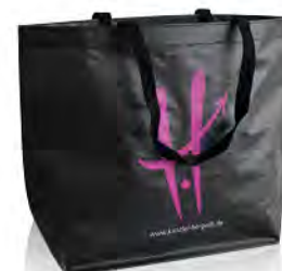
PE Woven mit 2 langen Nylonhenkeln