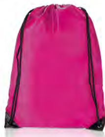
Polyester, untere Enden verstärkt in schwarz mit Metallösen