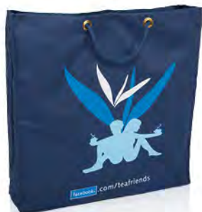
Baumwolle mit goldenen Metallösen und Baumwollkordeln