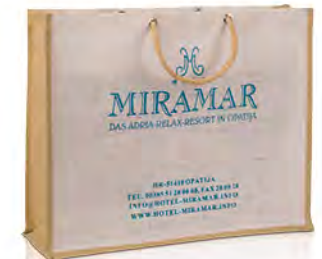
Jute mit Metallösen und Baumwollkordeln