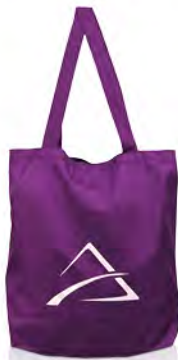
100% recyceltes PET mit langen Henkeln