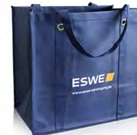
PP-Non Woven mit außen angehängten Griffen und Metallösen