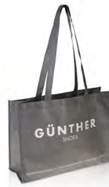
PP-Non Woven, 1-farbig bedruckt