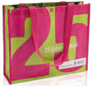
Einsäumung in pink und Druckknopf, mit glänzender Laminierung