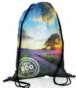
PP-Non Woven mit Stopper