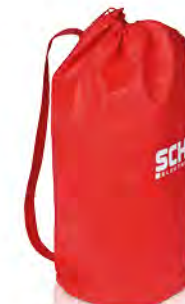
PP-Non Woven mit langem Umhängehenkel