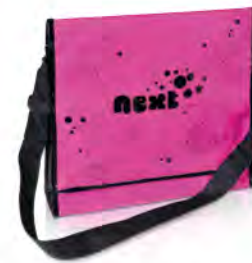
PP-Non Woven mit glänzender Laminierung und Paspelierung