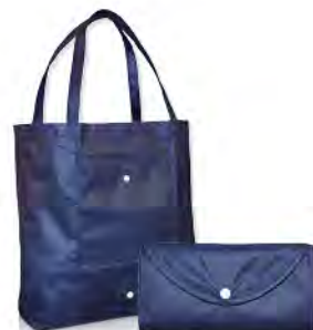
Polyester, faltbar mit Druckknopf