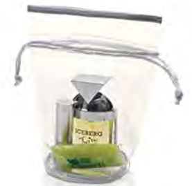
Transparent PVC mit Kordelzug