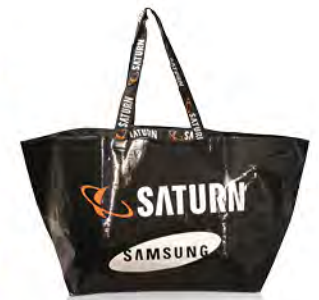
Textilband mit eingewebtem Logo und 2 versch. Henkellängen