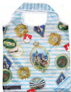
Nylon mit aufgesetzter Außentasche und Kordelzug