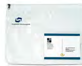
Dokumententasche, PVC transparent mit Reißverschluß und Einstecktasche