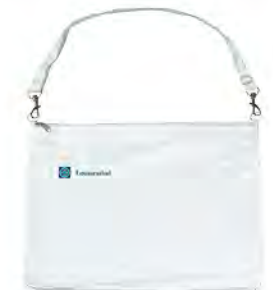
Dokumententasche, Nylon mit Tragegurt und Reißverschluß