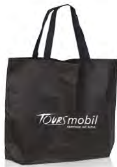
PP-Non Woven mit langen Nylonhenkeln