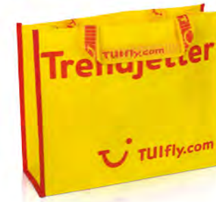
Textilband mit eingewebtem Logo